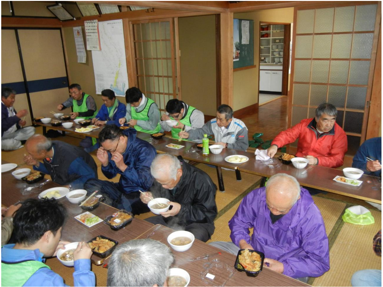
応援団員と地元参加者との昼食会。その後、自己紹介等で交流を深めた。