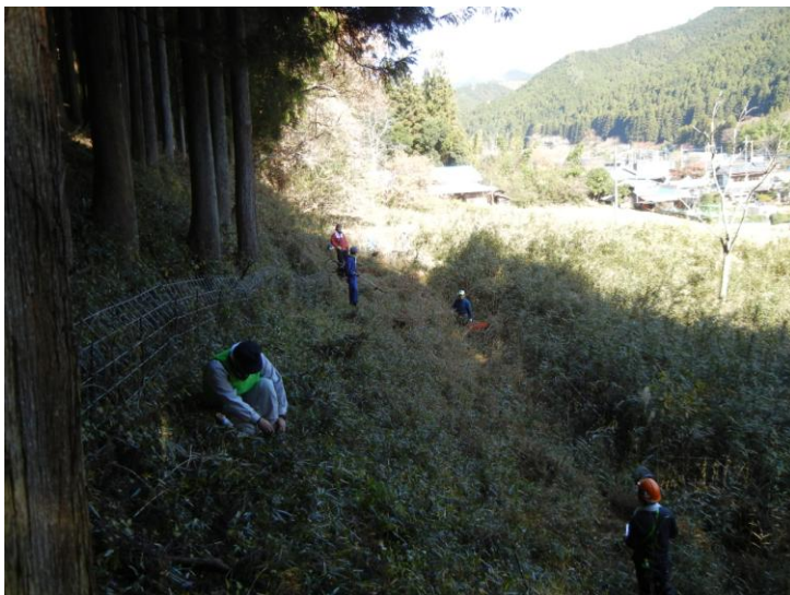
秋山川沿いや山すその獣害防護柵周辺の草刈りを行う応援団員