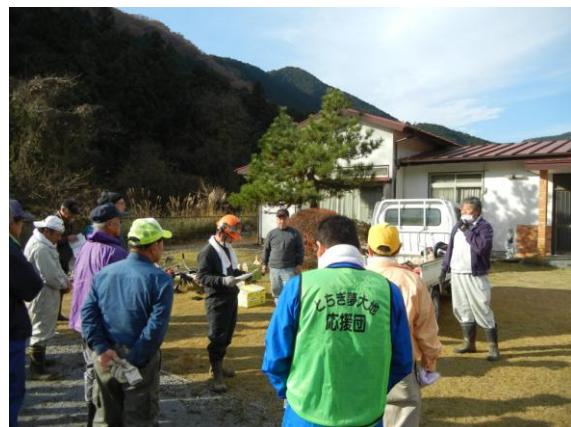
作業班を編制し、作業手順などの説明を受ける応援団員。