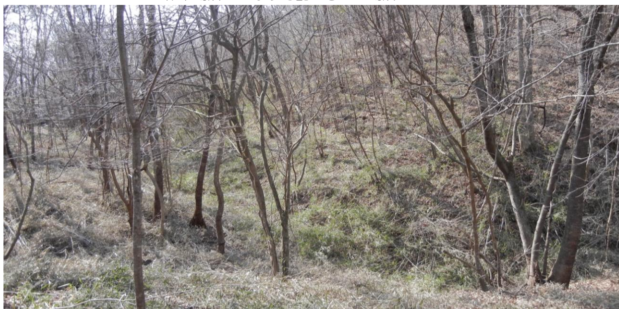
約2時間の作業で篠竹がきれいに刈り払われました