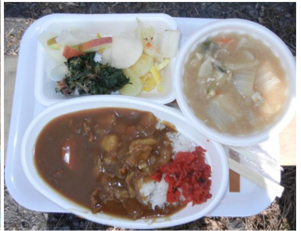
昼食は地元の女性たち手づくりのカマド炊きごはんのカレーライス、豚汁、漬物など