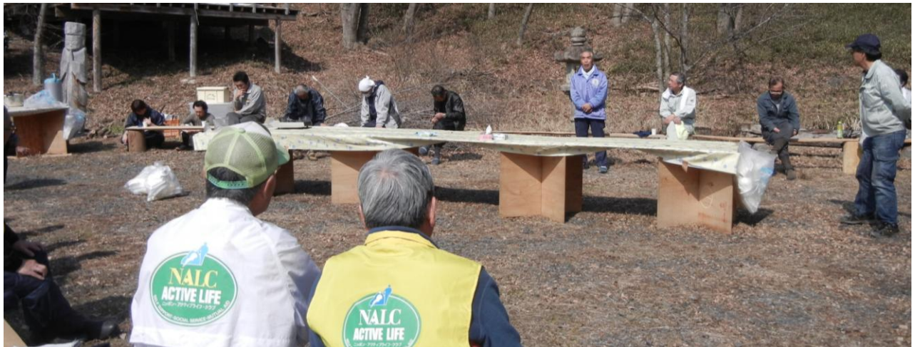
交流会では地元の人からお礼の言葉や小砂地区のPRが語られました