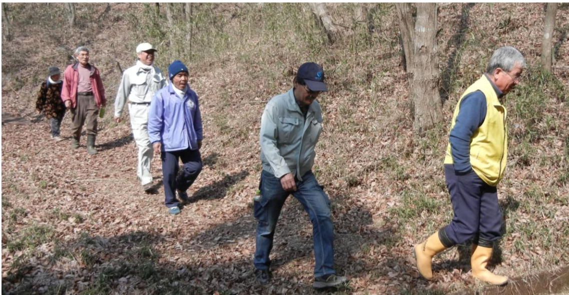
交流会のあと地元の方の案内で「よろこびの森」周辺を散策しました