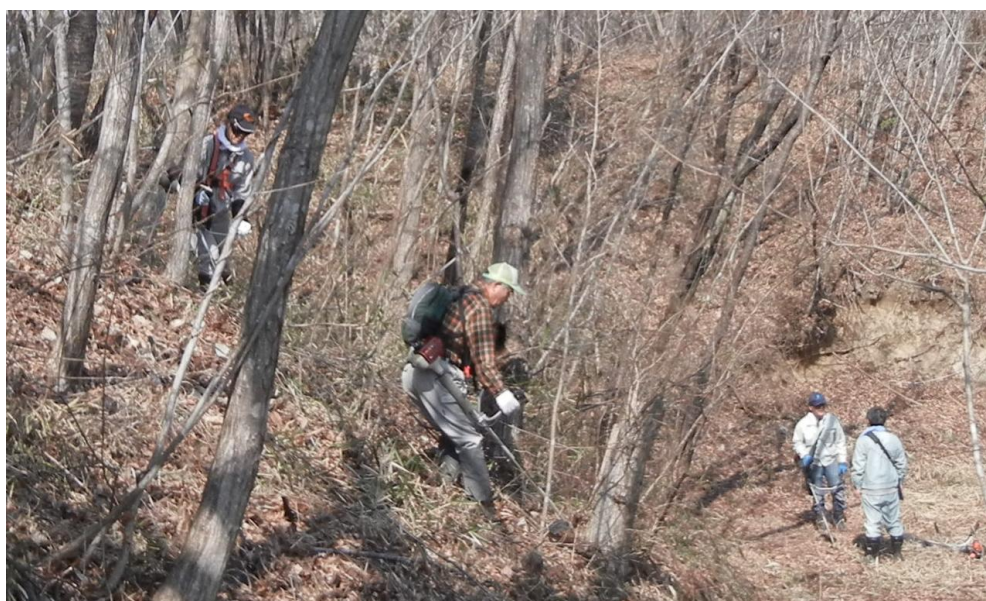
作業場所はかなり勾配のきつい場所がほとんどでした