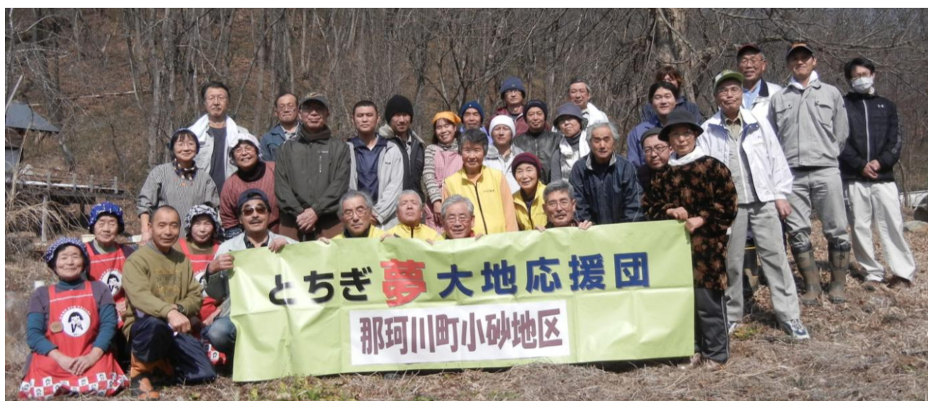
参加者全員で記念撮影