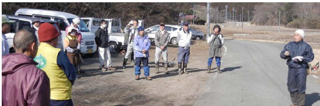
開会式で歓迎あいさつを行う小室那珂川町林業振興会長（右端）