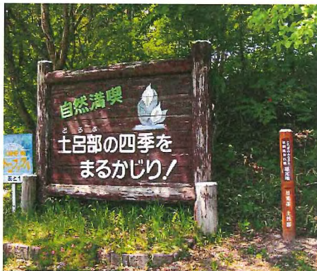
集合場所は、この看板が目印！！