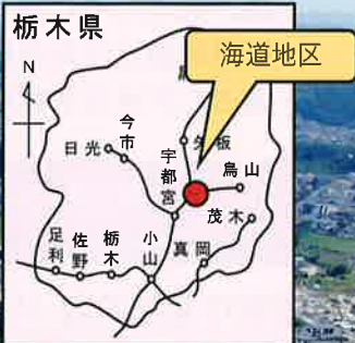
海道地区をドローンで撮影

海道町では、農地整備にあわせて「いちご団地」創設を計画しておりいちご経営者を募集しています