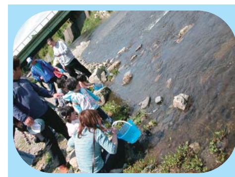
親子で放流 (大田原市)