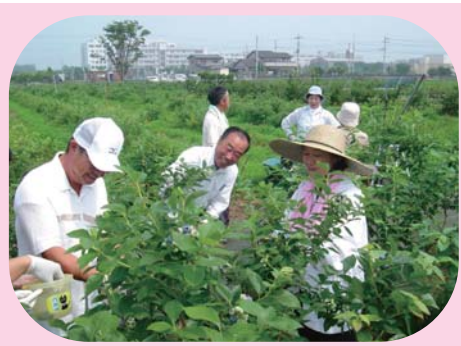
ブルーベリーの摘み取り (大田原市)

あたたかい人たちとの出会いや心の交流ができます。ふるさとに戻ったような懐かしい感じ、そんな体験ができる場所がたくさんあります。