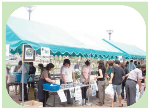
ブルーベリーまつり (大田原市)