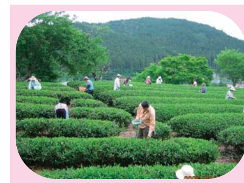
茶摘体験 (大田原市)