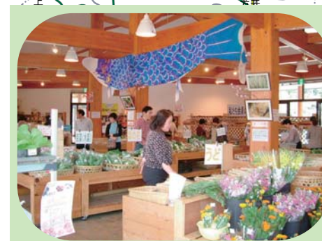
道の駅「那須与一の郷」 よいち直売所