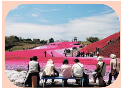
芝ざくら公園（市貝町）