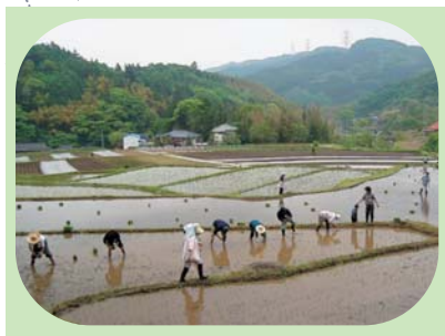
棚田での米づくり（茂木町）