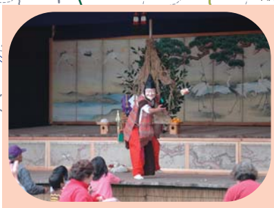
農村歌舞伎（益子町）