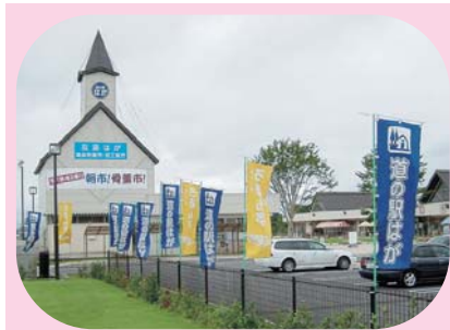
道の駅はが（芳賀町）

芳賀地区では、日本一の生産を誇る「いちご」をテーマに「いい芳賀いちご夢街道」づくりを進めています。このマップでは、街道の魅力的な施設の数々を紹介します。