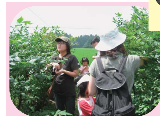
ブルーベリーの摘み取り (日光市)