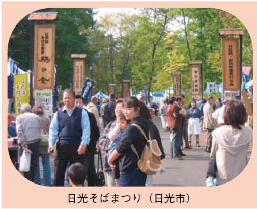
日光そばまつり (日光市)

物の味でのおもてなし…。温泉につかるもよし、歴史を訪ねるもよし、直売所をめぐるおいしさと素敵な出会いを見つけるもよし…今日は自分流のプランをたてて、新鮮な旅をしてみてください。