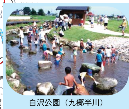
白沢公園（九郷半川）