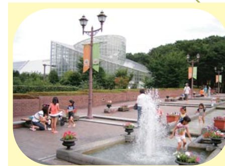
ろまんちっく村 (宇都宮市)