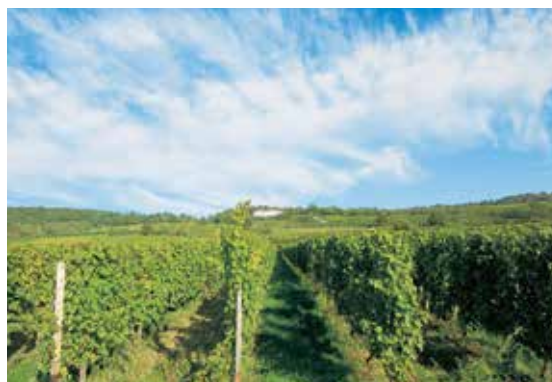
ドイツのワイナリーぶどう畑