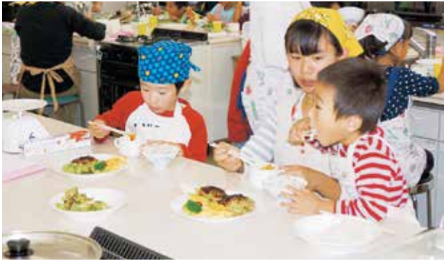
初めて食べる大麦料理（H28.10.22）