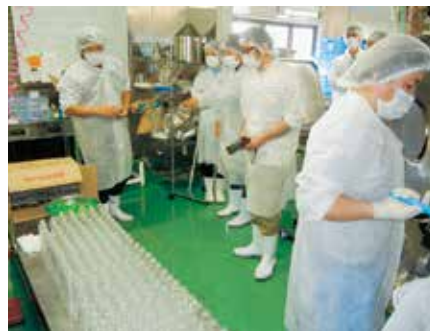
加工施設でのインターンシップ研修