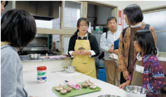
きのこの話を聞く（H28.11.19）

本講座に「親子で楽しむ食と農」コースを新設しました。今年度は、「大麦でクッキング」、「秋はやっぴりきのこでしょ!」、「米粉でクッキング」をテーマに、それぞれ食材のプロ（㈱大麦工房ロア・㈱北研・㈱波里）から、県産農産物の良さを伝えていただきました。