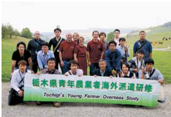
スイスの放牧場で

この海外派遣研修は昭和62年度から始まり、本県農業を担う青年を海外の農業先進国へ派遣し、農業情勢や経営の実態について調査研究するとともに、広い視野と国際感覚を身につけ、優れた農業の担い手として地域農業発展に貢献いただくことを目的に実施され、平成28年度で29回目となります。今回はスイス・オランダ・ドイツを視察・調査して参りました。派遣された青年農業者14名は、県内各地で先進的な農業経営を実践するとともに、地域のリーダーとして活躍しています。