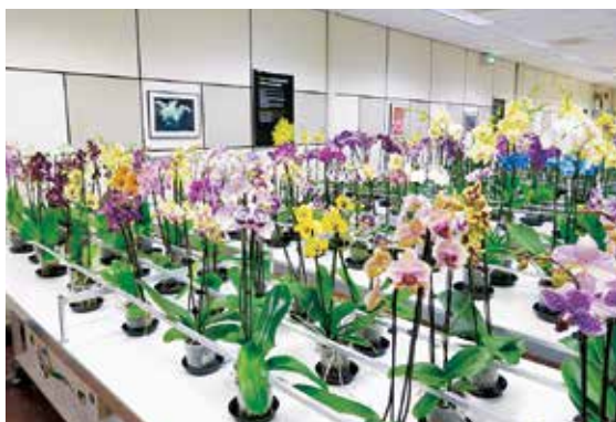
オランダのアールスメール花市場