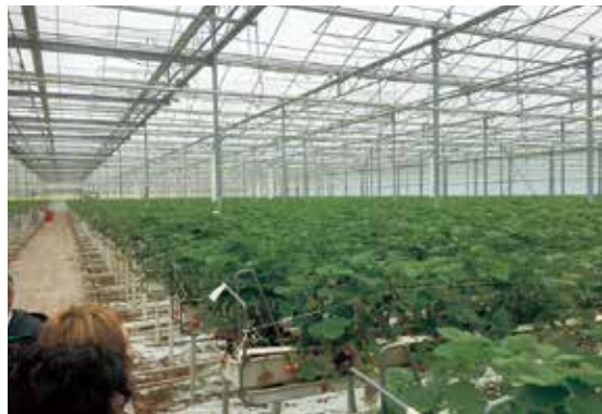
オランダの大規模いちご農家