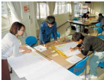
グループごとのワークショップ