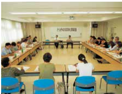
開 講 式

「6次産業化概論」をはじめ、「売れる商品づくり」や「ネーミングとパッケージデザインづくり」、「食品衛生管理」などをテーマに、半年にわたって計6回の講義とワークショップを行いました。今年度は、6次産業化の実践事業者へ出向いて研修するインターンシップも行いました。